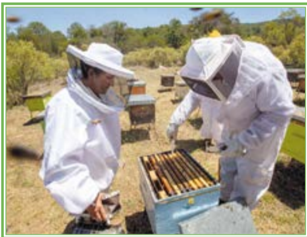
Los apicultores no han dejado participar en la mejora de la calidad del ambiente mediante la aplicación de prácticas “amigables con la biodiversidad”; estas incluyen la siembra o la reforestación con plantas nativas multipropósito, adecuadas para la producción de polen y néctar, alimento para ganado, alimento humano, etc.