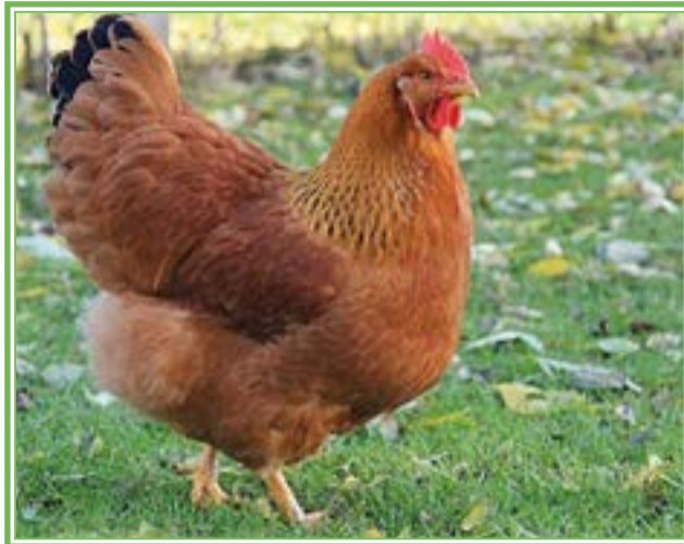
Gallina de la raza New Hampshire

Gallina Leghorn. Es una de las especies ponedoras con mayor rentabilidad y productividad. La mayor producción de huevos blancos proviene de las gallinas Leghorn . Proviene de los EUA, la cual fue creada a partir del cruce de gallinas italianas. Es una de las mejores gallinas híbridas, y actualmente ocupa los primeros lugares dentro de las aves ponedoras.