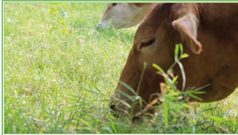
Una excelente opción para aumentar la productividad es la utilización de praderas de temporal

Importante destacar en esta nota, es que la Unión Ganadera dice que las zonas templadas de México se localizan en la parte central del territorio, abarcando desde los estados de Morelos y Puebla en su parte sur hasta Durango y Chihuahua en el norte. La precipitación en esta zona es entre 300y 1200 mm anuales, con el 80% de la ocurrencia de lluvia durante el verano, lo que provoca una estacionalidad en la producción de forraje.