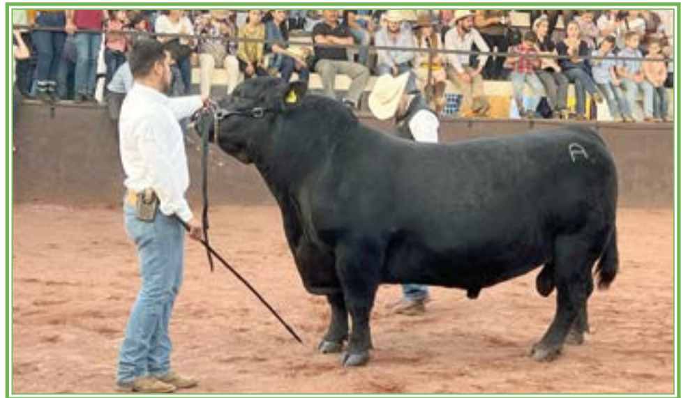
CALIDAD de sementales y hembras es el resultado de la constante búsqueda de parámetros productivos para ofrecer a quienes se interesan en esta raza.

Y en base a este criterio, fue como se dio origen a CRIALTOS, donde confluyen criadores de ganado de registro de la región.