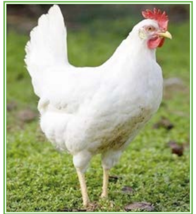
Gallina de la raza Leghorn blanca

New Hampshire. Desarrollada a partir de la raza Rhode Island Red en el estado de New Hampshire USA entre los años 1915 y 1935. Se importó a Europa en el año 1950. Son de color marrón rojizo. Puede poner unos 200 huevos al año. A partir de los 2 años de vida disminuye la producción de huevos y consumen bastante cantidad de comida. Ponen bien durante el invierno. Los mejores climas para su desarrollo son el cálido y el semi templado.