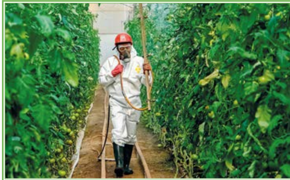
Autoridades regulatorias y representantes del sector agrícola, exportadores y de la industria de protección de cultivos de México, Estados Unidos y Canadá sostuvieron la reunión anual del Grupo de Trabajo Técnico Trilateral de América del Norte sobre plaguicidas (TWG, en inglés).

Estas medidas benefician a los agricultores de la región, quienes cuentan con los insumos y las regulaciones necesarias para producir alimentos confiables, lo cual les permite participar en el