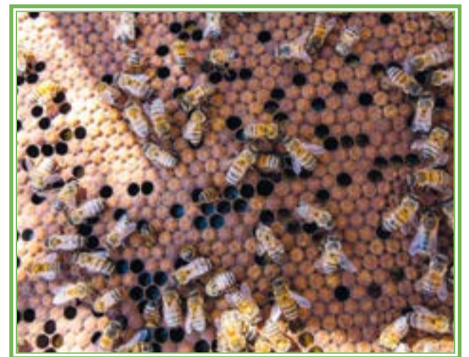
Las abejas son uno de los polinizadores más eficientes y, por tanto, colaboran con el mantenimiento, desarrollo y la regeneración de bosques y reservas naturales. Existen varias especies nativas que son polinizadores naturales de variedades originarias y que han sido cultivadas desde épocas prehispánicas en ciertas regiones de Mesoamérica.