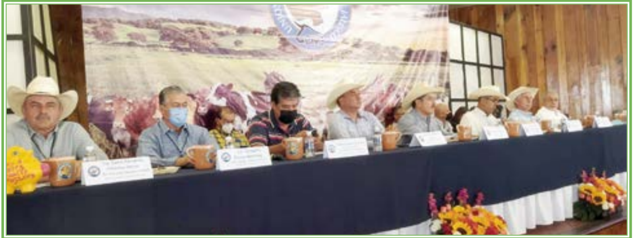
MESA DEL presidium en la celebración de la LXVII Asamblea General Ordinaria de la UGRJ.

de subdividir al municipio para que los ganaderos que cumplan con los requisitos, puedan sumarse a «Zona A» ya que actualmente, si en alguna parte del municipio resulta un animal positivo a brusela o tuberculosis, todo el municipio queda sancionado.