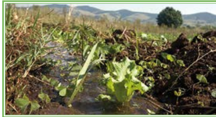
HAY diferentes tipos de agricultura que pueden favorecer al medio ambiente.

Finalmente llegamos a lo más disruptivo. La agricultura regenerativa. Por encima de todo integrativa, inclusiva, expansiva. Los suelos y quienes de él viven se entienden interconectados.