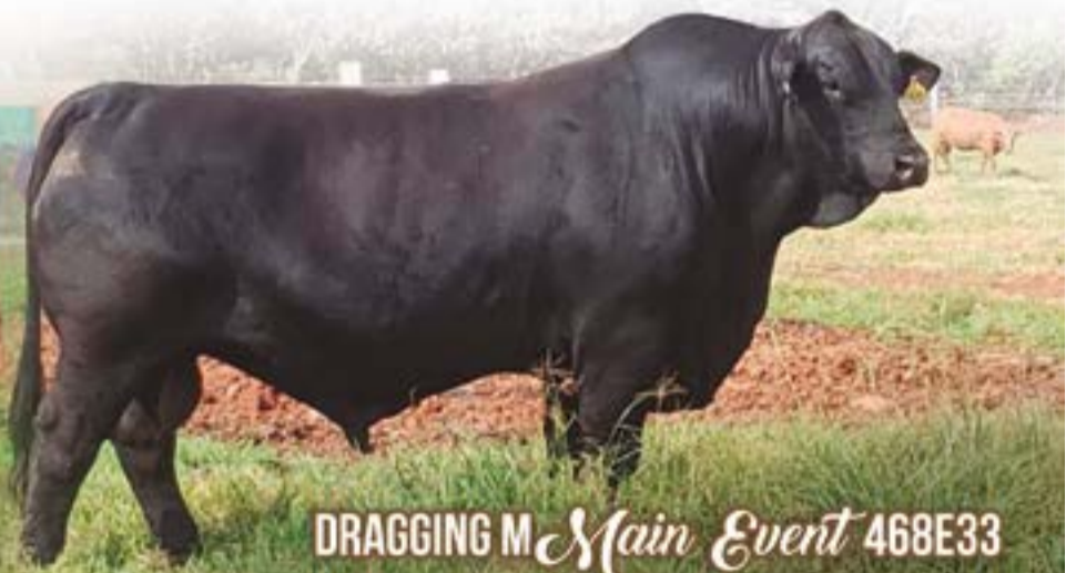
DRAGGING M Main Event 468E33