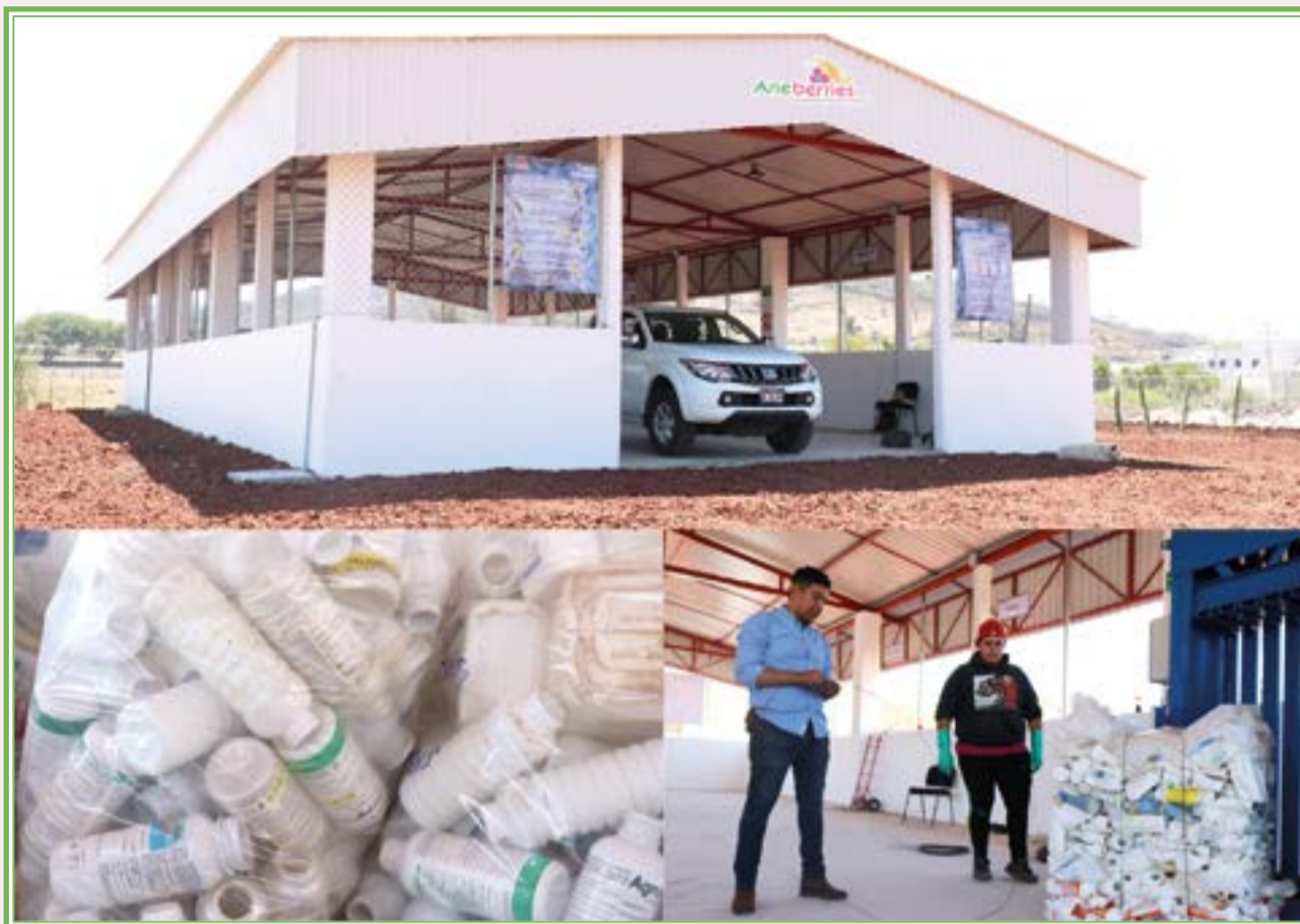
Centro de Acopio Temporal de Envases Vacíos (CAT) Jocotepec. Trabajo en alianza entre Aneberries, Campo Limpio Amocali A.C. y Gobierno del Estado de Jalisco.

Dejemos que la misma convocatoria lo explique: "Inspirados en pasión por la innovación y el compromiso de minimizar el impacto de los plásticos en la producción de berries, Driscoll's en asociación con Think Beyond Plastic y otros protagonistas de la