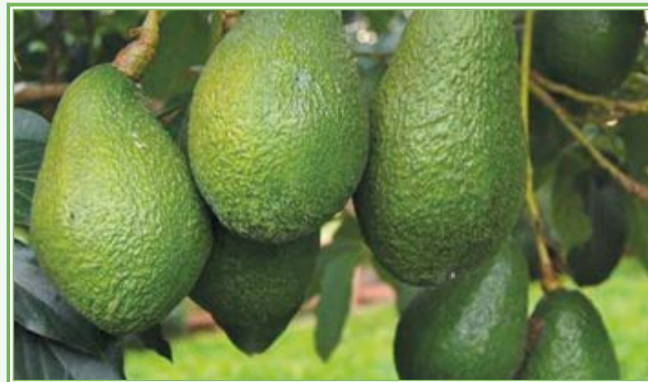
Aguacate Fresco Hass de México a Estados Unidos

En cuanto a inocuidad se deberán cumplir como mínimo con los requisitos de la Ley FSMA, que contiene los estándares establecidos por la FDA para asegurar la inocuidad de los productos agrícolas frescos, el cumplimiento de esta norma requiere capacitación al personal que labora en el huerto, por lo que recomendamos estar atentos a los avisos de APEAJAL y las JLSV quienes estarán gestionando este tipo de cursos.