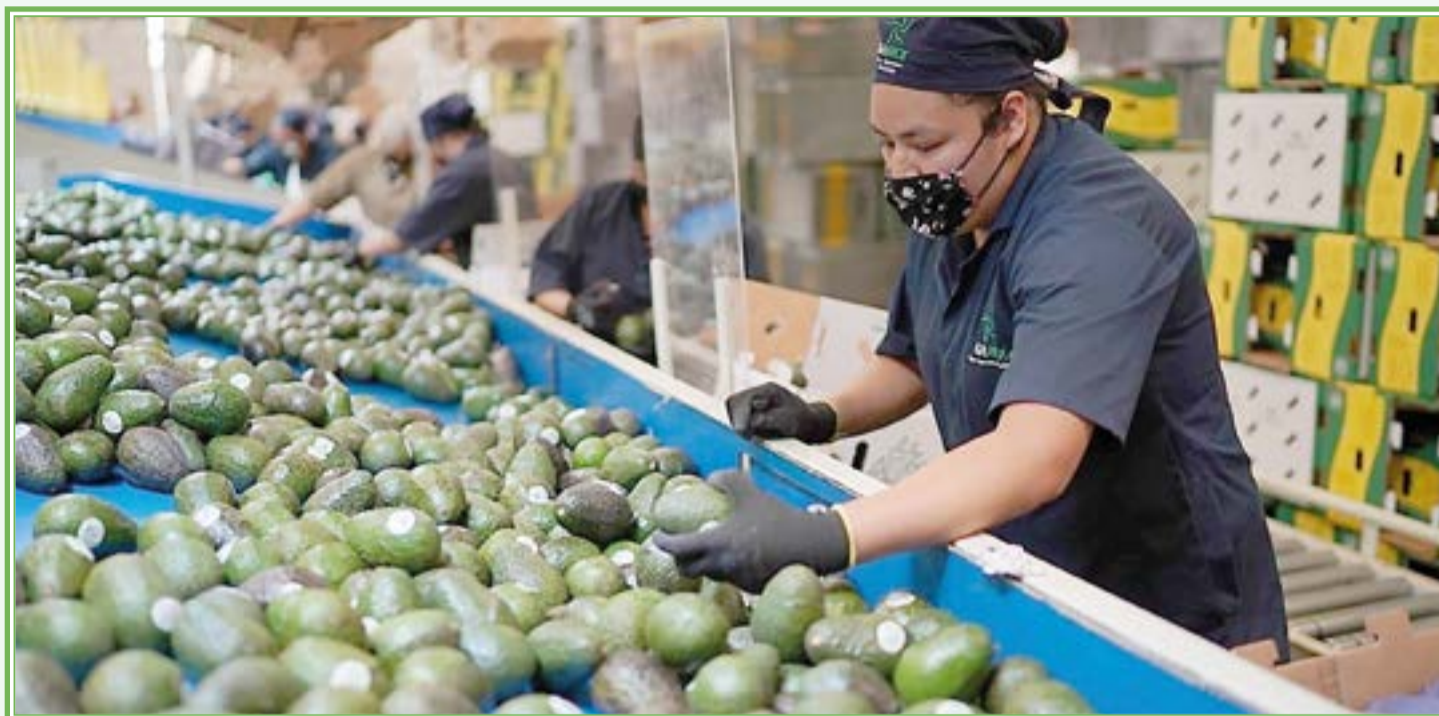
Los pasos previos para seleccionar y empaclar el aguacate para el mercado estadounidense

cuentra en un punto determinante, por eso si eres productor y estás pensando en sumarte a este proyecto hay cosas que tienes que considerar y que debes mantener: