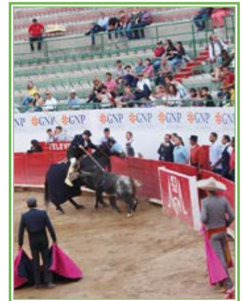
FIESTAS y charlotadas dan vida a varios pueblos en el país.

La fiesta brava ha sido declarada «bien cultural y material» en Tlaxcala, Aguascalientes, Hidalgo, Querétaro, Zacatecas, Michoacán y Guanajuato mientras que las corridas de toros están prohibidas en Sonora, Guerrero y Coahuila.