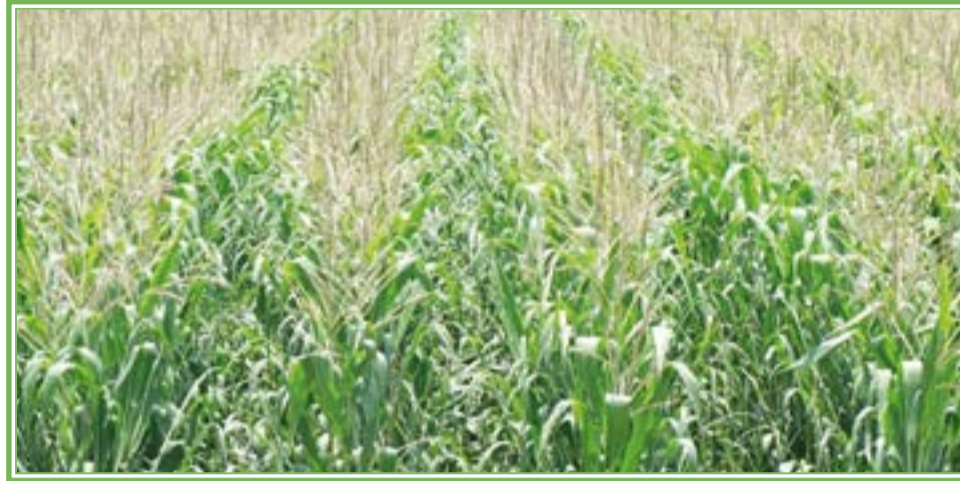
Parcela con híbridos de maíz.

2. Asistir a pláticas de promoción de distribuidores de semillas y eventos de campos de empresas semilleras. La oferta del mercado de semillas de maíz es tan grande que