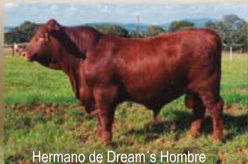
Hermano de Dream's Hombre