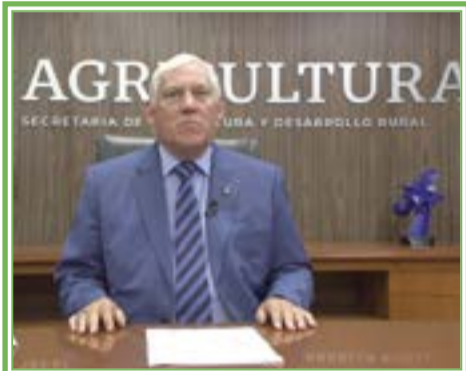
El secretario de Agricultura SADER, Víctor Villalobos Arámbula, expresó el compromiso de la dependencia federal: desarrollo con justicia en el campo mexicano.

Desafortunadamente, los jóvenes buscan en actividades ilícitas fuentes de ingreso para salir adelante", resaltaron.