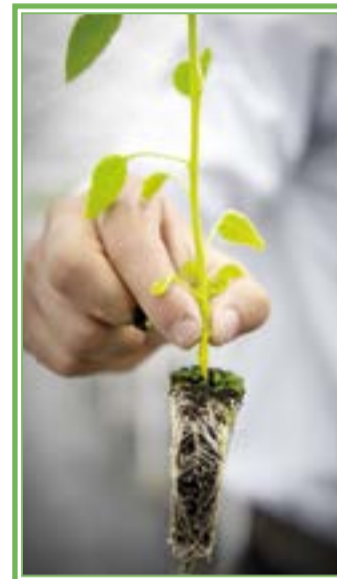
Plántulas mejoradas para facilitar el uso de material vegetativo

Añadió que nuevamente se harán las recomendaciones a los chileros para que recurran a la polinización de sus cultivos con las abejas, dado que se ha comprobado que con la presencia de estos insectos se tienen incrementos de por lo menos 20 por ciento en la producción de esta solanácea, de gran importancia en la gastronomía regional.