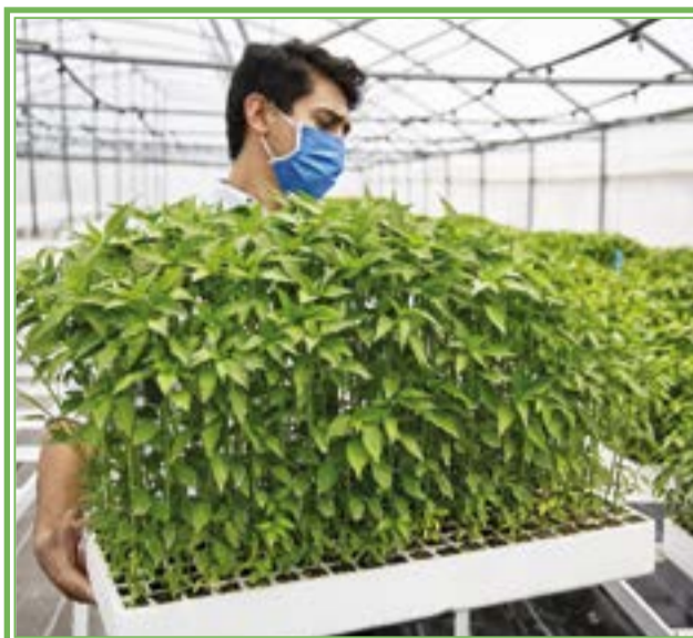
Producción de plantas, tarea primordial del Instituto del Chile

refirió que además del reparto de las semillas mejoradas, se brinda capacitación a los agricultores chileros, en lo que se resalta la necesidad de asegurar la inocuidad en el proceso de obtención de las simientes.