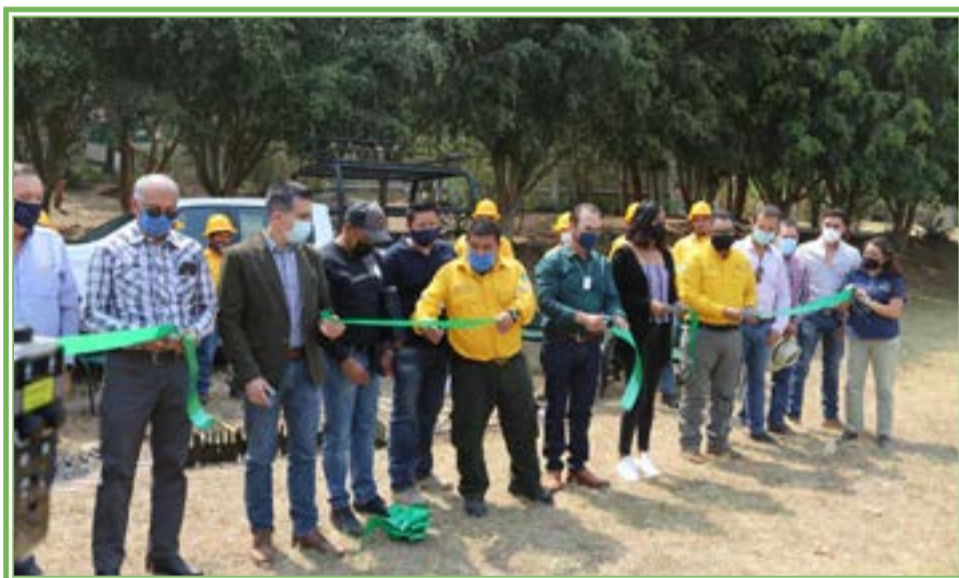
PRESENTAN a la nueva Brigada Forestal que trabajará en la zona sur de Jalisco.