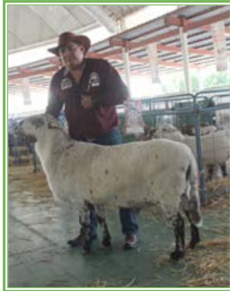
ZAPOTLANEJO es la sede de la muestra anual de esta raza de borregos.

lificación, en la que pasaron alrededor de 200 animales.