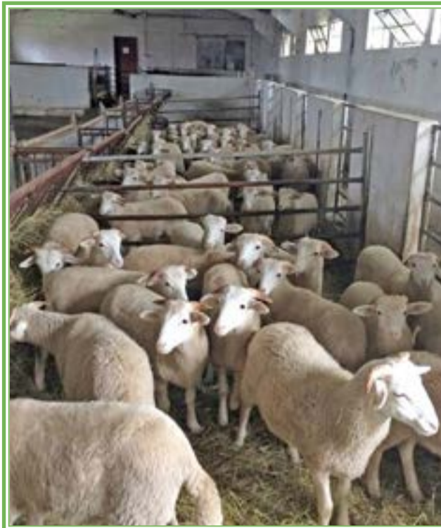
ALIMENTO balanceado, necesario en cada una de las etapas de desarrollo del borrego.

A través del desarrollo que ha alcanzado la ovinocultura, las forrajeras han volteado a ver al sector ovino y ahora, prácticamente en cualquier forrajera, por lo menos, puedes encontrar lo que son las tres