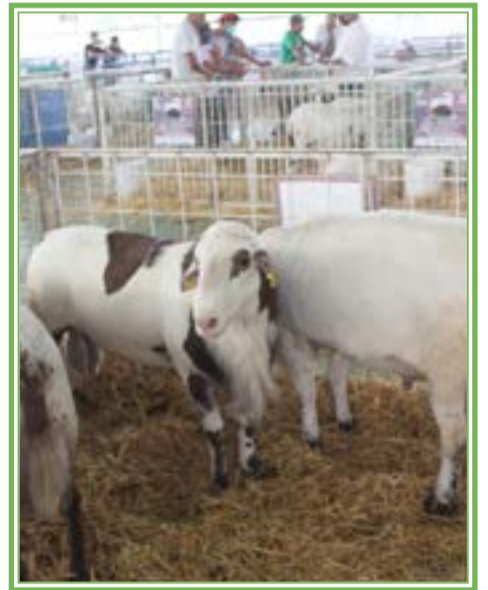
DIFÍCIL situación ha creado el aumento en el costo del insumo para los ovinocultores.