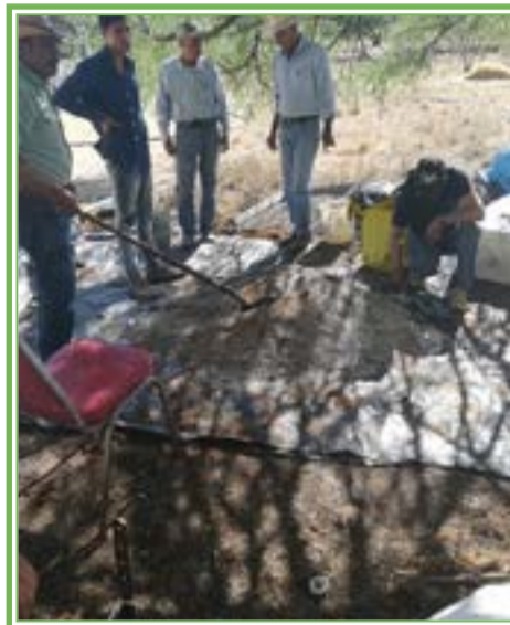
Preparación del sustrato para la siembra.

de bajos ingresos y de acopiadores que operan con infraestructura de beneficio y transporte.