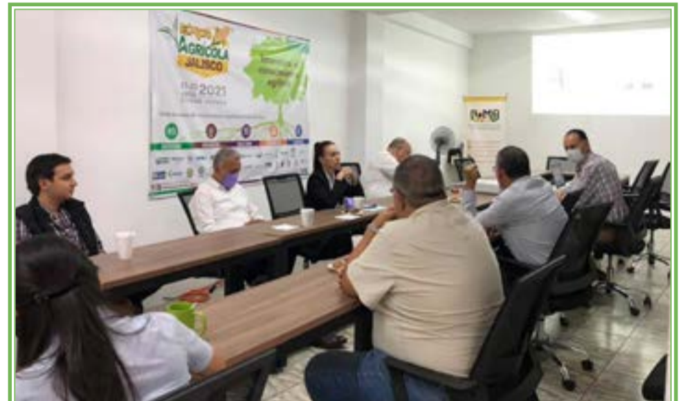
DIMA, continúa con sus actividades agroempresariales y durante mayo, conjuntamente con COPARMEX, se realizaron reuniones de trabajo.

En esta sesión se presentó virtualmente un recorrido por el Pabellón de