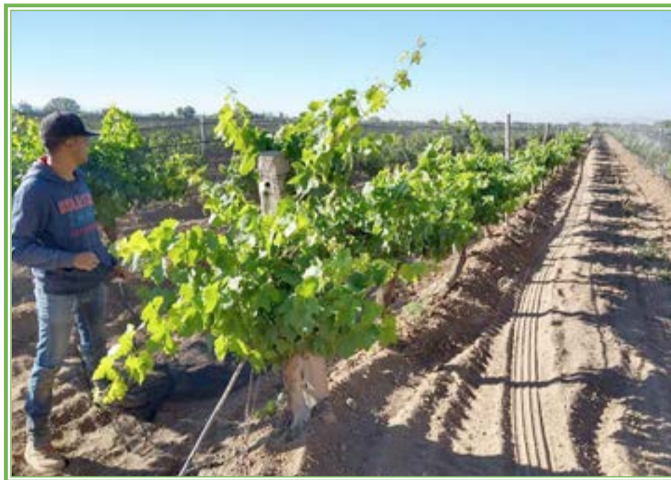
«El llano en llamas» es ejemplo de opción de diversificación agrícola donde se suponía que eran «tierras yermas».