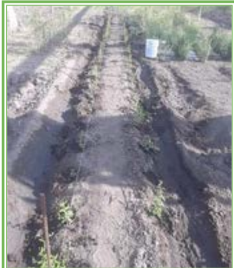
Trabajos de investigación sobre siembras comerciales en CUNORTE, Colotlán.

Lo avances se están midiendo con resultados: algunos productores socios ya tienen siembras comerciales en las localidades de Minillas, Potrero de Navarrete, Las Carreras, Los Toriles y Las Bocas, todas del municipio de Mezquitic. 85 son los productores que se integraron al proyecto de varias localidades, todas de la zona mestiza. En estas etapas, ya se requiere de apoyos de la iniciativa privada para que vaya creciendo, sobre todo en la creación de infraestructura que genere valor agregado. Van creciendo las siembras comerciales, aparte de las de Mezquitic, también en Colotlán en las localidades de El Epazote, Mesa de Guadalupe y Mesa de Flores.