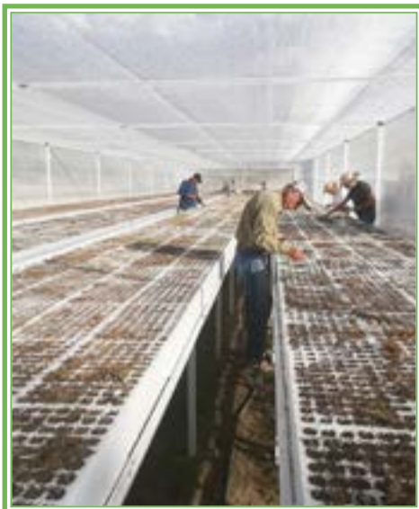
Siembra de semilla en vivero de Los Toriles.

Si bien existe un potencial de extracción anual de 29 mil toneladas, en la actualidad, se conocen varios centros de acopio, almacenamiento y beneficio, lo que da una idea del impacto económico, social y laboral, pero puede ser mayor.