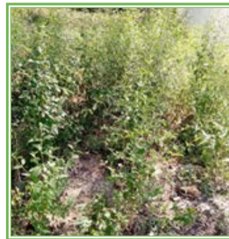
Siembra de orégano domesticado en la localidad de Minillas, de Mezquitic

Dos años se han recorrido con resultados más que satisfactorios, ya que se ha tenido la participación de los diversos actores, en algunos casos de forma parcial y otros muy decidida, de propietarios privados que rentan sus predios con existencia del recurso y que van a medias o a tercios en la recolección, de comunidades agrarias y ejidos, de recolectores