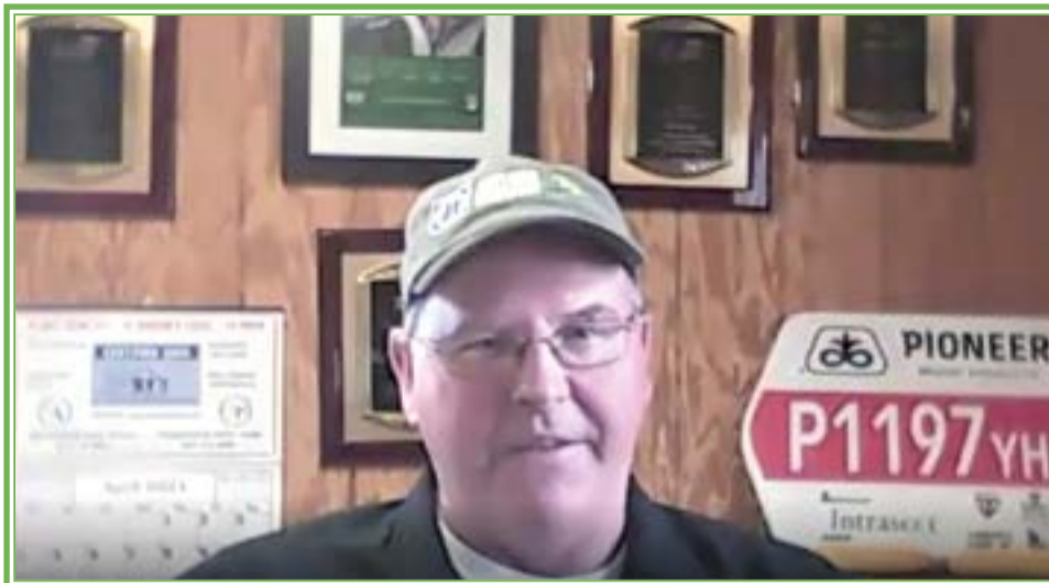
Durante la realización de este grandioso encuentro efectuado de forma online en el que participaron más de 500 personas entre productores y asesores

Por ello y ante los escenarios que prevalecen en el medio rural, INTAGRI fiel a su compromiso de capacitar a los agricultores, llevo a cabo el pasado mes de abril, el Foro INTAGRI sobre Producción de Maíz de Alto Rendimiento.