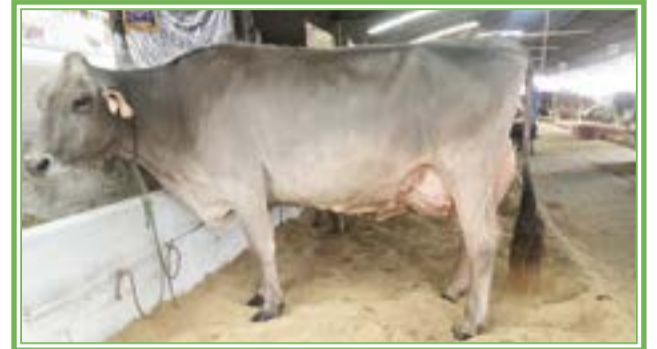
Rancho El Barroso.