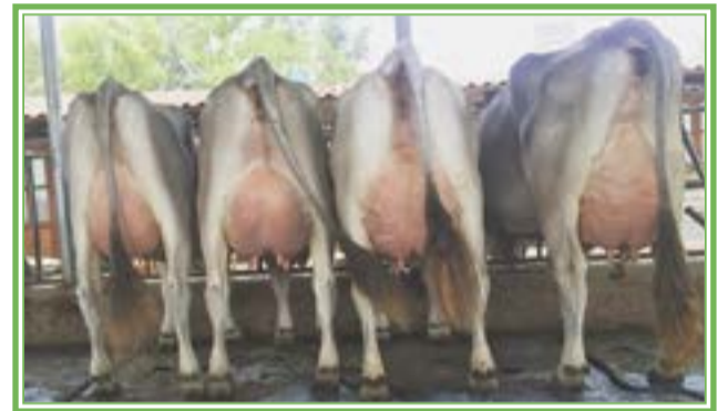
Rancho El Barroso.