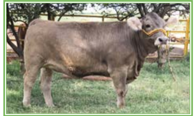
Rancho Gena Agropecuaria.

Por características de producción, reproducción y gran rango de adaptabilidad, el suizo constituye un recurso genético de gran valor.