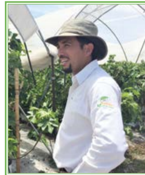
«Acercarse con comercializadoras, establecer convenios y coordinación para las épocas de cosecha y los volúmenes de producción».