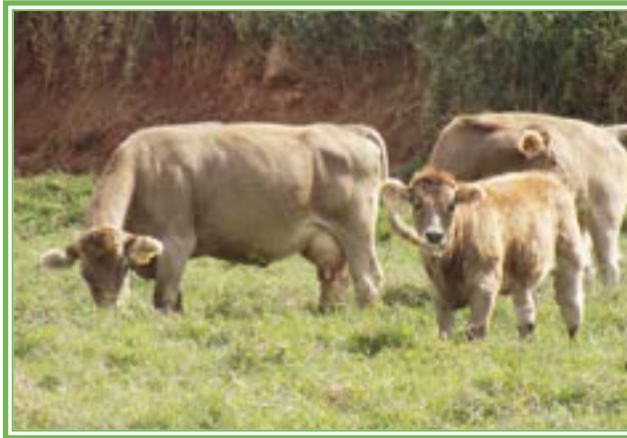
Rancho Gena Agropecuaria suizo europeo.

Características.- Mejores patas y pezuñas. Menor incidencia de trastornos metabólicos. Excelentes para pastorear. Viven y producen leche por más tiempo. Tienen ubres más limpias y de mejor textura.