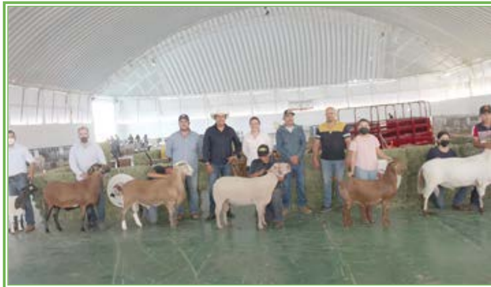
ORGANIZADORES y ejemplares que se tuvieron en la tercera exposición Ovicam.

«Este es un proyecto que nace de cuatro productores de aquí mismo de