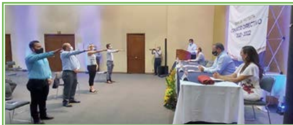
NUEVO Consejo Directivo ANFACA 2021.