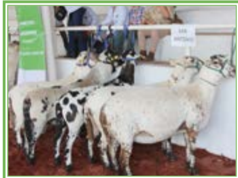
OVINO Pelifolk... una raza que no se ha querido reconocer por las autoridades federales.