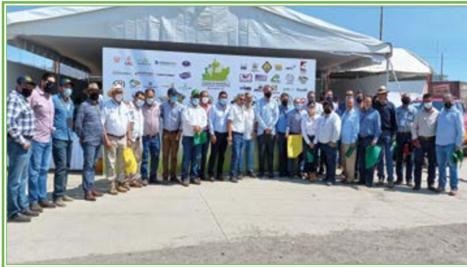
Consejo Nacional Agropecuario y Consejo Agropecuario de Jalisco CDAAJ, en gira por la región sur del estado

*Campañas fitosanitarias para el estado; coordinación entre la Agencia es-