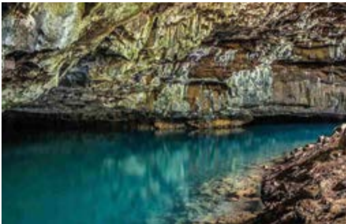
Asegurar el aprovisionamiento de agua subterránea