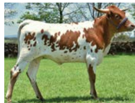
Rancho San Francisco.