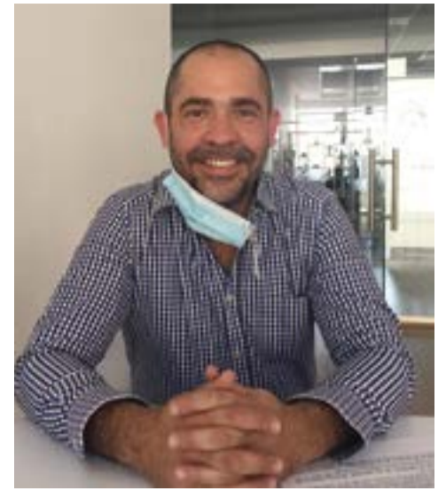
Gerardo Cárdenas, vicepresidente de la Comisión de Recursos Hidráulicos y Energéticos.

La ley de aguas nacionales es reglamentaria del artículo 27 constitucional en materia de aguas nacionales y tiene por objeto regular la explotación, uso y su aprovechamiento, además de la distribución y control, así como la preservación de su cantidad y calidad para lograr su desarrollo integral sustentable.