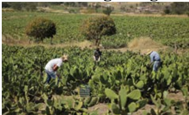
Nopal... especie alimenticia de gran demanda.

Este agricultor mencionó que ya son cuatro décadas de tradición nopalera en San Esteban y poblados