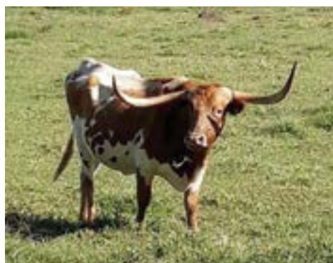
Rancho San Francisco.

REPRODUCCIÓN.- Una de las cualidades más deseables de la raza es su alta fertilidad. Existen pocas razas ganaderas que puedan igualar sus tasas reproducti-