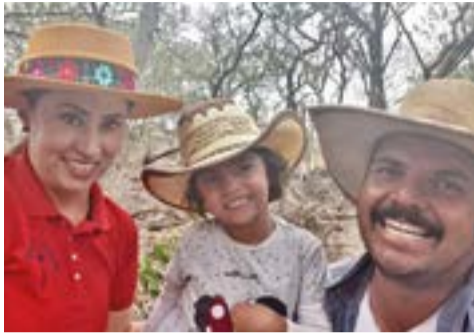
La familia y el tesón, los secretos para alcanzar las metas.

de formarse como ingeniero agrónomo, cree que se está logrando un trato igualitario a la mujer que se desempeña en el campo, porque están cada vez más preparadas y ve que existe un reconocimiento del derecho de las mujeres a participar en las mismas condiciones de igualdad en actividades agropecuarias que en ocasiones son muy "pesadas".