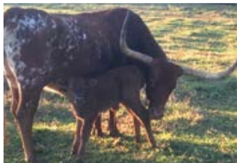
Rancho San Francisco.