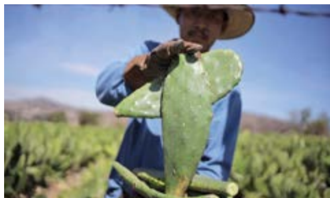
El nopal como alternativa de agronegocio

Destaca que la capacidad del nopal para sobrevivir en climas áridos y secos con suelos pobres lo convierte en un elemento clave en la seguridad alimentaria. Además de proporcionar alimentos para el consumo humano y animal, el cactus almacena agua en sus pencas, convirtiéndose así en un "pozo" botánico capaz de suministrar hasta 180 tons de agua por ha, suficiente para mantener cinco vacas adultas, lo que supone un incremento sustancial sobre la productividad típica de los pastizales.