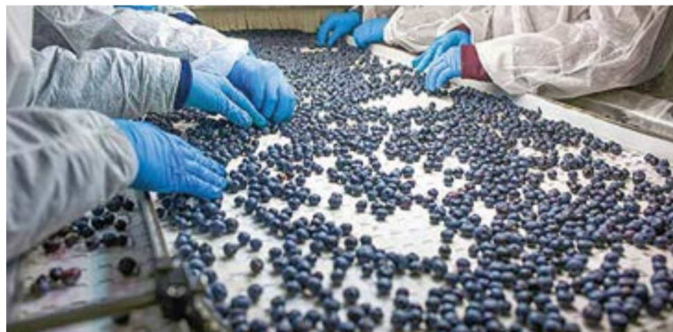
En México, siempre se contempla la protección a los trabajadores en este tipo de plantaciones.