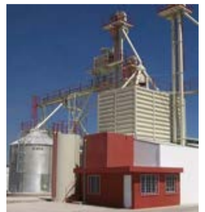
Redacción. - AGRO21 Comunicación Rural

La Agencia Estatal Jalisco que está ubicada en Guadalajara dentro de la sede de la Coordinación Regional Centro Occidente que atiende 9 entidades federativas, coordina la dispersión de créditos de forma directa a través de las Agencias de Crédito establecidas en Ameca, Autlán, Ciudad Guzmán, Guadalajara, La Barca, Puerto Vallarta, Tepatlán, así como en Lagos de Moreno, las cuales tienen como meta colocar este año 6,000 millones de pesos.