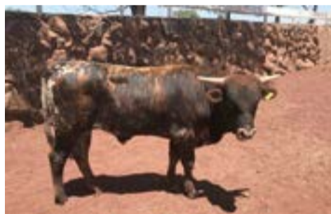
Rancho San Francisco.

vas altas, cuenta con la precocidad sexual por primera vez a los quince meses de edad y luego tiene un ternero cada año hasta los 16 años.