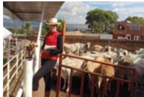
Actualmente se dedica a la engorda de bovinos