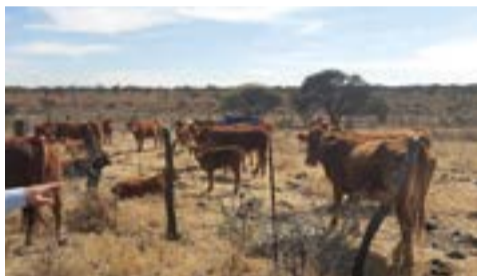
Ganado Limousin en un rancho en Valle de Guadalupe, Jalisco.

"No es un sistema como tal, creo que es un estilo de vida, de producir alimentos de valor biológico para el ser humano, que es