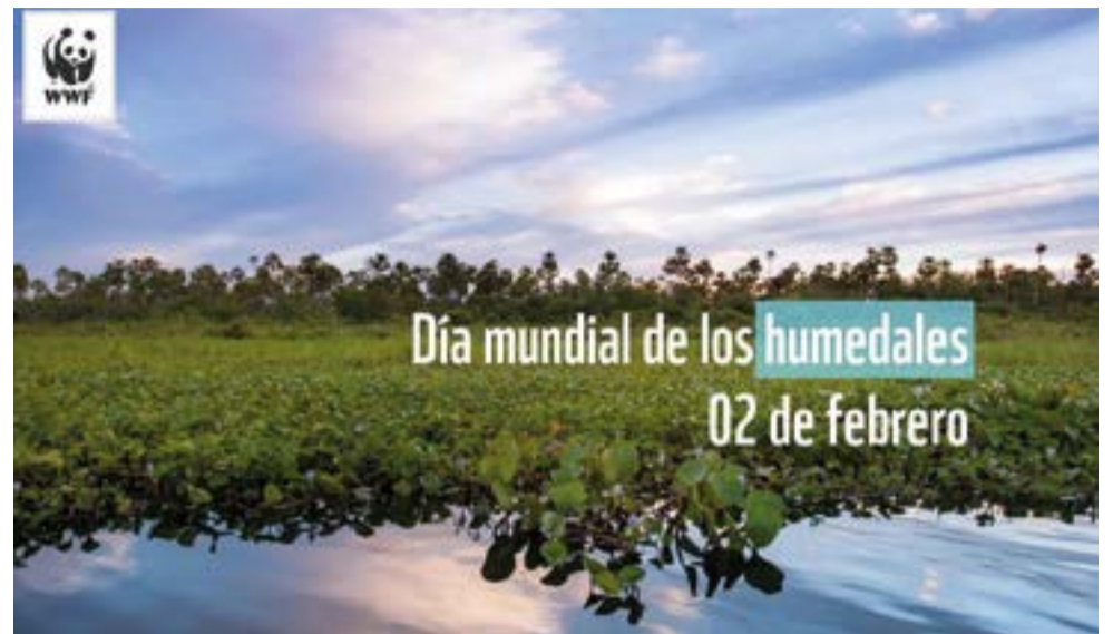
Todo está conectado: aguas subterráneas y humedales

Algunos de los efectos de la reducción del nivel de las aguas subterráneas son la reducción de los rendimientos de los pozos, el incremento de los costos de bombeo, hundimientos en el terreno, compactación