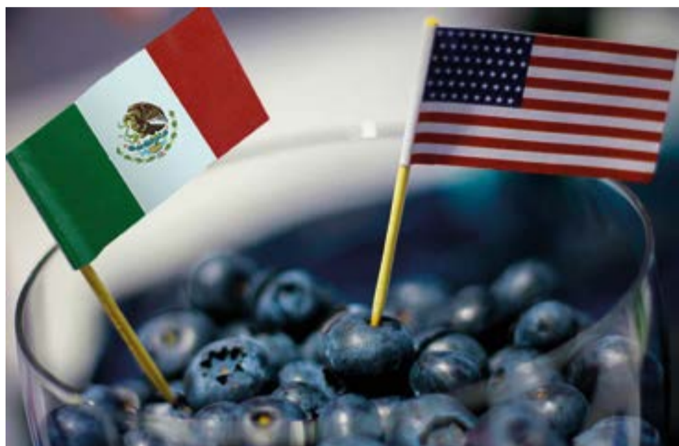
Estados Unidos tiene un consumo máximo histórico de arándanos.

A neberries invita de nueva cuenta a los productores de berries a fortalecer los esquemas de inocuidad y a mejorar su cumplimiento en materia de responsabilidad social y manejo de plagas. Son bienvenidas las aportaciones y fondeos que puedan considerar necesarios para el apoyo a este nuevo reto reconociendo que los productores son muy profesionales y competitivos.