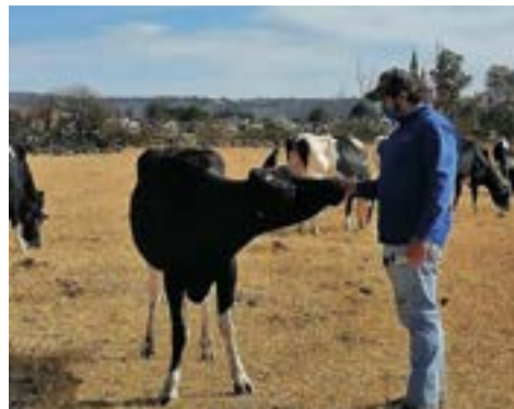
Christian: "que bien se siente ser participe del bienestar animal, seguridad alimentaria y regeneración de suelos".

cas como el manejo del pastoreo racional como lo sostiene el investigador André Voisin; "la disponibilidad continua de agua limpia, sombra y sales minerales, la eliminación del uso de herbicidas, anabólicos y algunos desparasitantes que dañan los microorganismos del suelo, así como la utilización de razas bovinas adaptadas al entorno, buscando rusticidad y conversión eficiente de forrajes a carne y/o leche son formulas para lograr su uso racional".