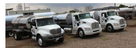
PIPAS adquiridas dentro del "Proyecto Margarita".