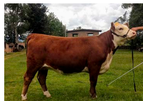
Rancho El Huilote