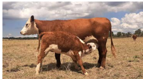
Rancho El Regladero