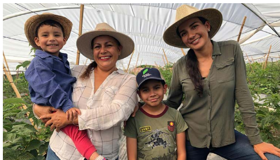
La familia es sostén del trabajo.