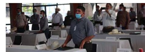
SANA DISTANCIA se tuvo entre los asistentes.