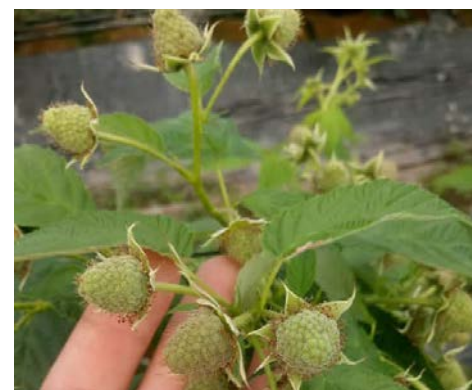
Desarrollo del fruto para la primera cosecha

Hay numerosos casos de éxito. Los agricultores innovadores, el sumarse a esquemas productivos sustentables, permitan un mayor acercamiento con el consumidor, lo que no solo resultará benéfico para sus ingresos y la productividad de su agroempresa, sino que se volverá primordial.