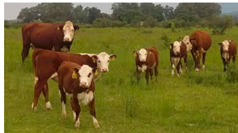
Rancho El Huilote