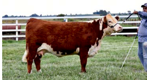
Rancho El Regladero