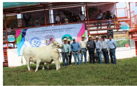
Campeona de Campeonas, hembra Charolais del rancho “La Providencia”

Los grandes campeones resultantes del evento de juzgamiento, fue una hembra Charolais, propiedad del rancho “La