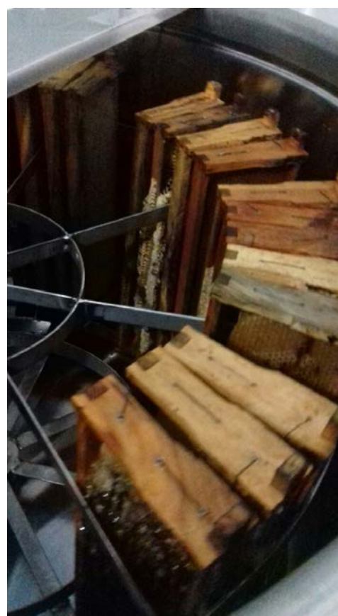
Extractor de miel con bastidores llenos de miel

De los autores: Datos de contacto felipebecerra5@gmail.com cel 317 104 3319. R