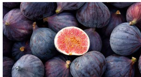
Fruto fresco con aceptación de los mercados consumidores

Variedades disponibles y aceptación en el mercado. Aunque existen cientos, las variedades disponibles en el mercado y que tienen gran aceptación debido a sus cualidades organolépticas son la Black Mission, Brown turkey, Sierra, Kadota, Kalimirna y tiger, siendo la primera la más diseminada en el mundo y algo muy importante a considerar es la aceptación del consumidor en el mercado.