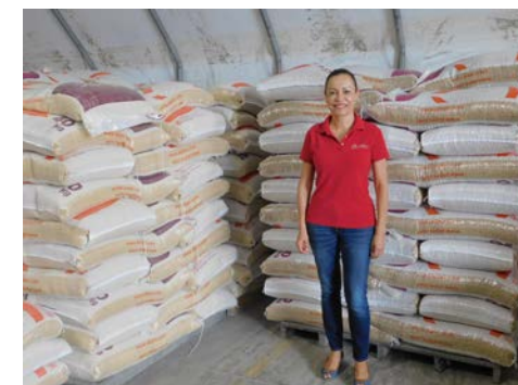
Producto terminado de alto rendimiento en su agronegocio.

para el sector agropecuario, la seguridad alimentaria y la sociedad. De este modo, el acceso a determinados recursos aumentaría la productividad agropecuaria de modo que la producción rural quizá en el país se incrementaría visiblemente”. R