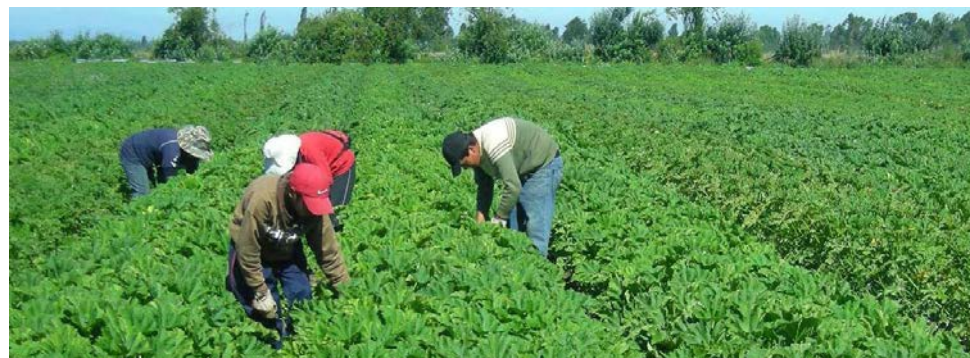
Labores en el campo de alfalfa

Los métodos de siembra más utilizados son dos: Primero, es cuando se tiene un sistema de riego por aspersión; en este método es lo más sencillo ya que la preparación del terreno se hace