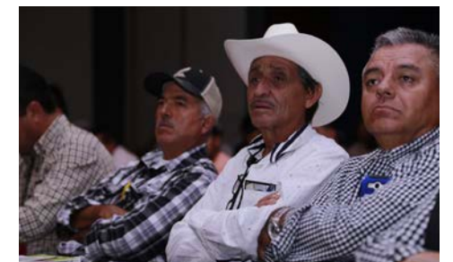
Productores de limón en el Congreso

En el marco de la realización de un Congreso y encuentro con productores, se confirma la expansión de más del 200% del limón persa en el campo jalisciense lograda en los últimos años con la participación cada día de más productores en este fruto-vegetal, lo que indudablemente es una señal de más opciones productivas y rentables que se presentan para beneficio del sector rural.