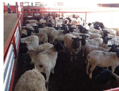
Manejo ovino de buena genética