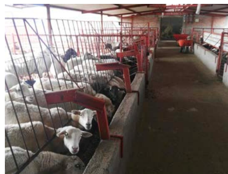
Hato de borregos de Eusebio

Eusebio Romo Díaz, da a conocer su teléfono móvil de contacto: (474) 569 8100.R