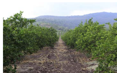
Plantación de limón por la región Valles