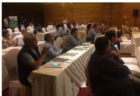
Reunión con gran asistencia y participación

El 4 de octubre se realizó una asamblea más como cada año lo hacemos. En esta ocasión el puerto de Veracruz fue la sede donde nos reunimos para analizar y revisar qué hemos cumplido los últimos meses, así como planear las tareas por venir.