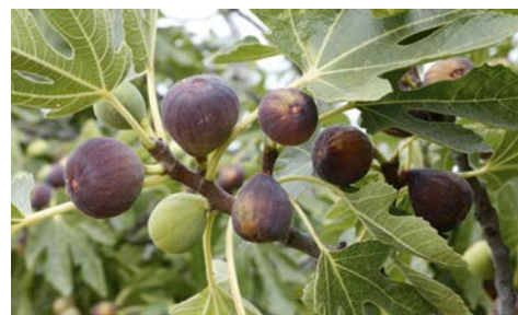
Planta de la higuera

Cuánto tarda en producir. La higuera, es planta noble y manejable capaz de producir frutos desde la base de sus ramas y dependerá del programa de manejo y el paquete tecnológico, la primera cosecha. Plantaciones de baja densidad y manejo extensivo, es regular obtener la primera cosecha después de un 1 año. En manejos de mediana y alta densidad la primera cosecha se obtiene a los 9 meses, posibilitando obtener 1.5 cosechas al año. Existen tres paquetes tecnológicos dependiendo de la densidad de plantación. Extensivo, semi-intensivo e intensivo.