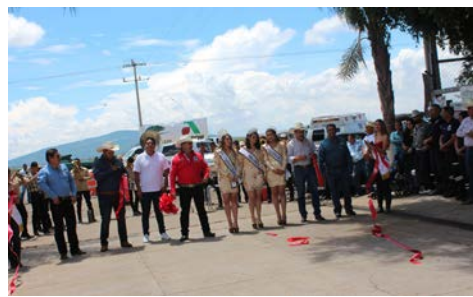
Acto protocolario de inauguración