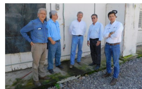
En la visita a este importante proyecto rural