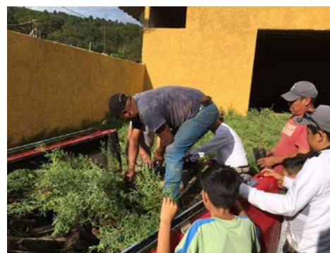
Recibiendo la planta forestal que va a los huertos