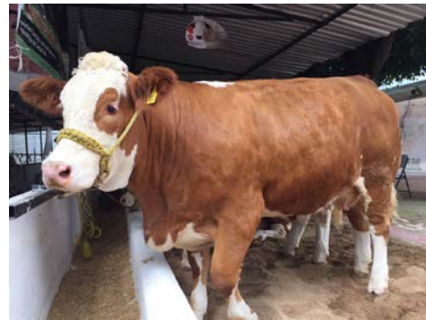
Ganado de registro y de alta calidad