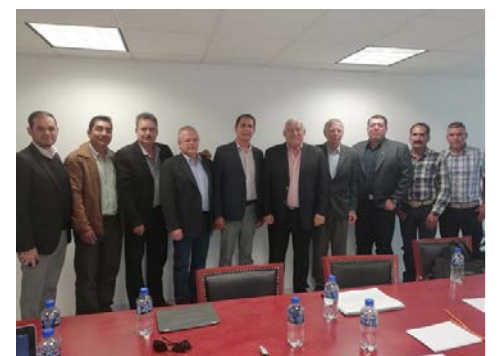
Los líderes de los gremios de porcicultores del país con Víctor Villalobos

Víctor Villalobos planteó realizar campañas de promoción a la carne de cerdo, así como a proteger a los productores de los productos que entran al país y que en ocasiones pueden ser precios Dumping que afectan, como es el caso de la pierna y espaldilla. Comentó que hay que revisar de cerca este tema y tomar medidas al respecto en favor de la actividad productiva. R