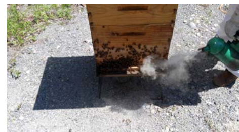
Una colmena poblada a punto de ser revisada

Indudablemente el estado cuenta con una gran diversidad de flora y de climas que permiten que se produzca miel en todas las regiones, donde encontramos incansables y trabajadores hombres y mujeres y que permiten aportar el 10 % de la producción de miel nacional, generando ingresos por más de 300 mdp anuales. Solo el año pasado nos presentan como el primer estado productor, situación generada, porque los