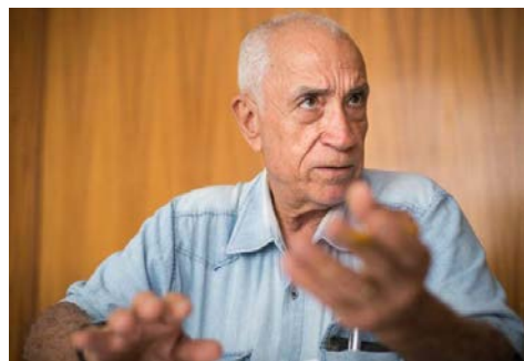
Figura mundial el investigador y agrónomo Sebastiao Pinheiro

con un bajo costo y una gran sencillez y la información que ofrece es muy valiosa. Además, su sencillez hace que cualquier persona sea capaz de poder hacer sus propias cromatografías y conocer la calidad de su suelo, de los alimentos producidos. De manera sencilla, la cromatografía permite ver en un soporte de papel, como es la interacción entre minerales, materia orgánica y microorganismos. R