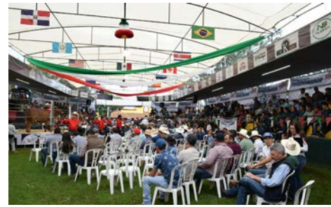
Notable asistencia a la subasta de ganado de registro