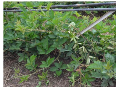
Síntomas en plantas adultas y parcela destruida por Fusarium oxysporum f. sp. mori en zarzamora.

Sin duda, la mejor herramienta para manejo de la enfermedad es el uso