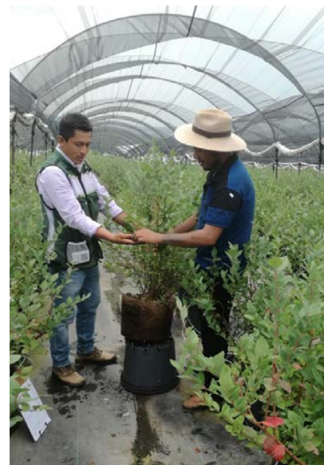
Una buena organización y comunicación da buenos resultados