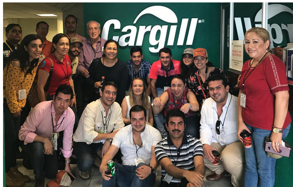
Los asambleístas en visita a Cargill

grande de México, ya que pasará de mover 25 millones de toneladas en su primera fase a 95 en la el año 2030.