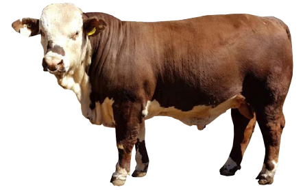
Ejemplares mostrados como el Hereford

inclusive algunas paridas de las razas Angus, Brangus, Limousin, Simmental, Charolais y Beefmaster. Dio también a conocer que los precios anduvieron sobre los $80,000 promedio. Fue notable que el subastador en todo momento estuvo motivando a los ganaderos para que se diera la mejor postura y al mismo tiempo se hacían comentarios y detalles de cada lote para explicarles al público en general del cual valía la pena hacerse de un excelente ejemplar.