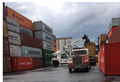
Un aspecto de cómo está actualmente el patio de contenedores