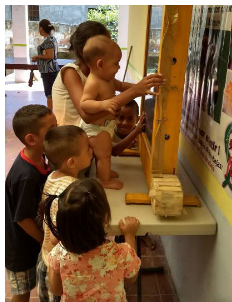
Los hijos de las mujeres que se capacitan en apicultura, los futuros apicultores

Nota importante es que la producción se reporta sobre unas 5,700 toneladas de