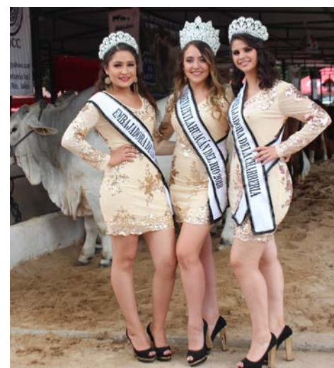
Bellas Reinas de Ixtlahuacán del Río

generan empleos y otras actividades que de manera indirecta dan participación de sus beneficios a los pobladores. Estos beneficios llegan a las familias de más de 30 localidades. R