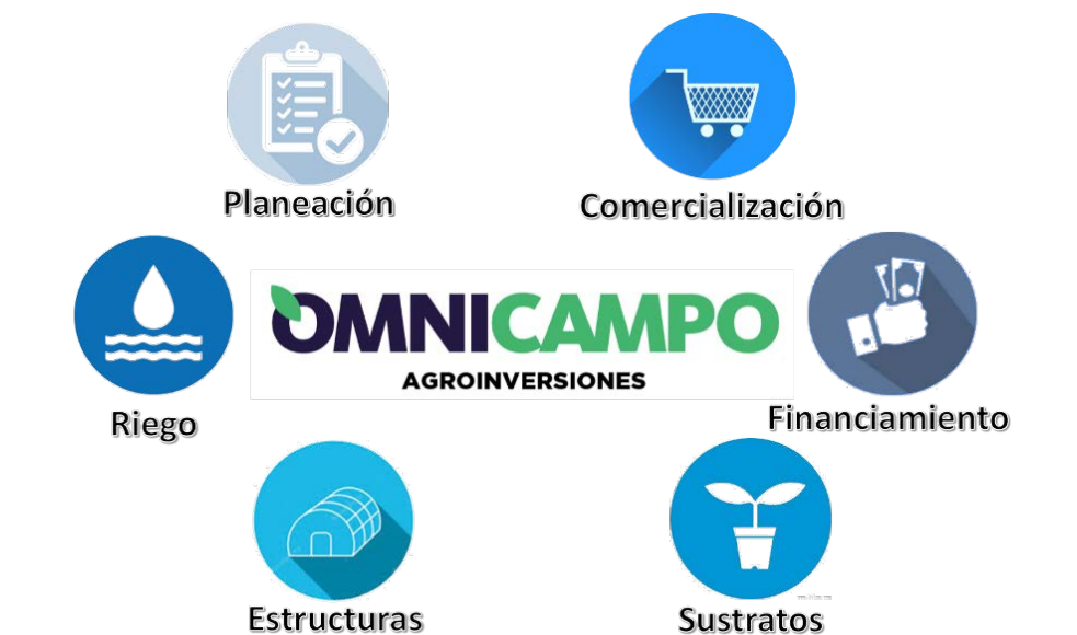
Modelo de Integradora con sus nodos de proveedores

En una reuniones con los directivos y fundadores de este tipo de empre-