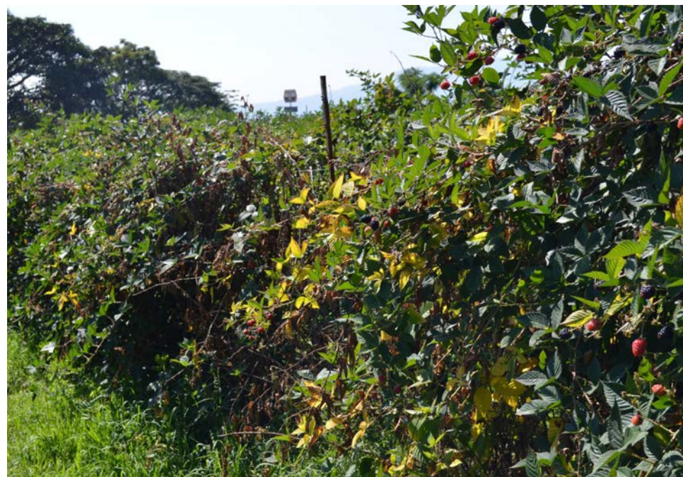
Plantas en desarrollo mostrando síntomas iniciales de la marchites de la zarzamora.

materia orgánica y fuentes de carbono) que promuevan la competencia, parasitismo, antibiosis y refuerzo de la inmunidad vegetal, incluyendo la disponibilidad de nutrientes.