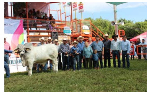
Campeón de Campeones, macho Brahman, del rancho “Santo Domingo”

También en su mensaje Blaz Rodríguez resaltó que la Asociación Agrícola desde su creación hace 42 años, muchos de los productores socios de esta, también están dedicados a la producción ganadera de bovinos leche y carne, cerdos y borregos y que esta agrupación sigue siendo un eje de desarrollo que impulsa la economía de las localidades en donde habitan sus asociados, por lo que a través de sus actividades productivas, además de los beneficios que obtienen, también se