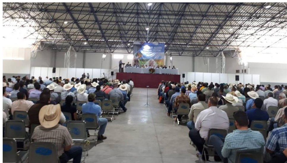
Notable asistencia de casi mil productores

Habló del tema importante del crédito, indicando que se va discutir y reformular el papel de la Banca de Desarrollo para seguir contando con el crédito al campo y anunció también un programa de crédito a la palabra para la ganadería de pequeños ganaderos. Un programa que les permita acceder a fondos, recursos y créditos para