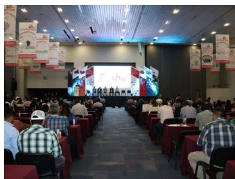
1,650 participantes en esta Octava edición Aneberries

A la par de estos temas, se expusieron charlas dirigidas a técnicos y productores con temas como "Impactos de los agroquímicos sobre el medio ambiente y su efecto en el cultivo de las Berries", "Nuevos retos asociados a patógenos en Berries: virus y parásitos", "Determinación de Límites Máximos de Residuos en México, normativa nacional y comparativa con los principales países destino", entre otros.