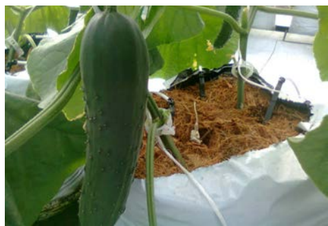
Pepino en sustrato

Los sustratos son, tal vez, la evolución más clara de esa búsqueda por nuevos modelos de producción. No solo brindan características físicas y químicas que por sí mismas representan ventajas sobre los cultivos tradicionales, sino que también demuestran un ahorro en el rendimiento de los cultivos y hasta una relación más sustentable y amigable con los entornos ambientales.