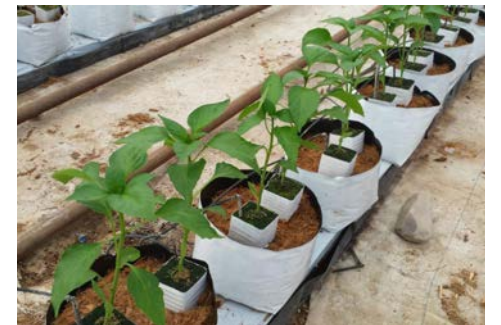
Sustrato producto enteramente composteable

cultivo en cualquier zona sin importar el tipo, calidad o patógenos del suelo; además genera ahorros en costos de fertilización beneficios considerables al medio ambiente con un producto con un producto enteramente composteable, sino que nos permite una producción orgánica en terrenos que no lo son, ya que el establecimiento del cultivo se da en un medio físico con certificado OMRI.