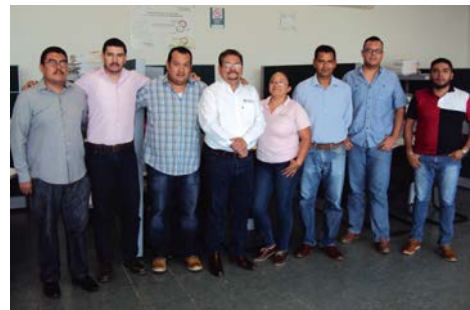
Personal y equipo de trabajo de la Financiera Nacional de La Barca

Financiera Nacional de Desarrollo FND y el Comité Nacional Sistema Producto Agave Tequila trabajan conjuntamente para formalizar el proyecto de financiamiento para los productores de Agave Azul. Los dirigentes del Comité se reunieron en oficinas de la Agencia Estatal Jalisco con funcionarios de la Institución crediticia