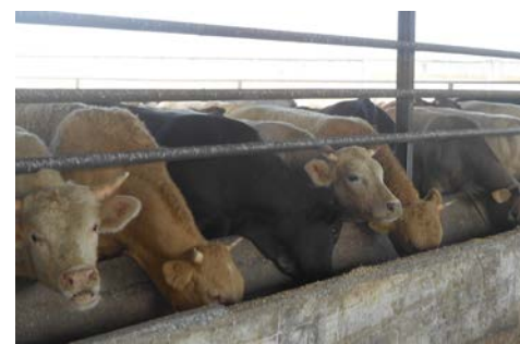
En su ambiente ganadero del día a día