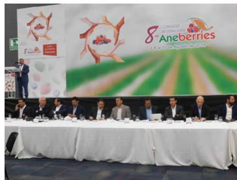
Inauguración con la asistencia de autoridades y Consejo Directivo