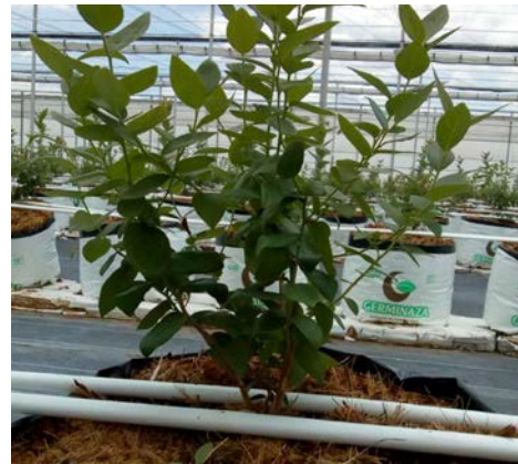
El sustrato de fibra de coco

Un estudio de la Universidad de Huelva en España, realizado en fresas cultivadas en un sustrato de fibra de coco, muestra cómo el requerimiento de agua es hasta un 40% menor en ciertas etapas fenológicas, mientras que el gasto en nutrientes puede bajar hasta en un 45%.